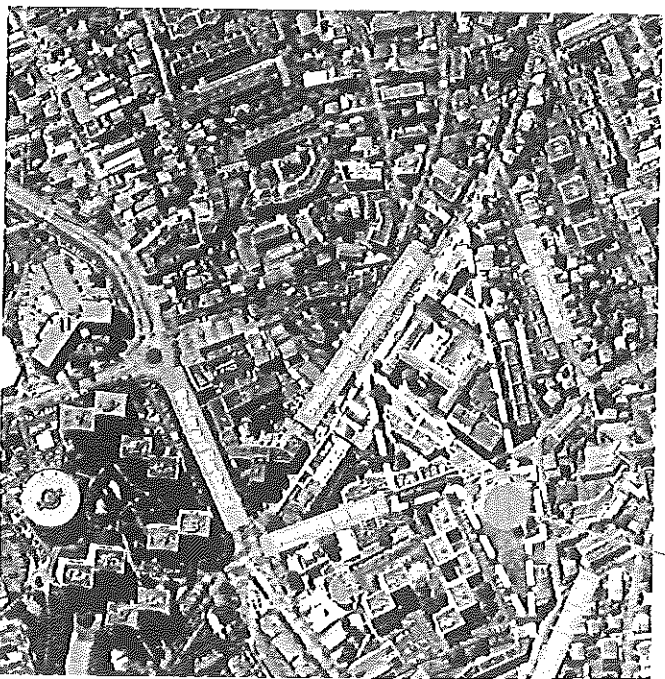
Google Earth - Image satellite du 14/06/2012

Le quartier novateur des Normaliennes c'est : un projet de 300 logements, une école maternelle, un réseau de chaux, un parc paysager, des services, 3 000 à 3 500 m 2 de bureaux ou locaux d'activités et des logements de standing.